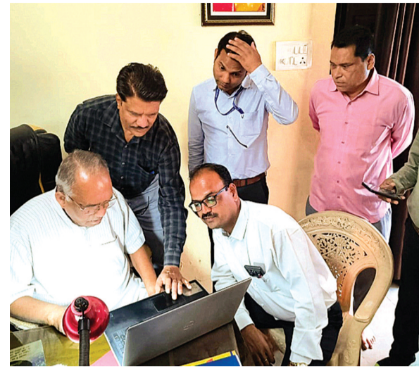
हरिभूमि न्यूज ▶▶ राजगढ़

भारत सरकार द्वारा पूरे देश में जनगणना-2027 के प्रथम चरण का कार्य आरंभ किया जा चुका है। इसी कड़ी में कल 16 अप्रैल से स्व-गणना आरंभ हुई है। यह कार्य आगामी 30 अप्रैल तक चलेगा एवं इसके उपरान्त 1 मई से 31 मई तक मकान सूचीकरण कार्य आरंभ होगा।