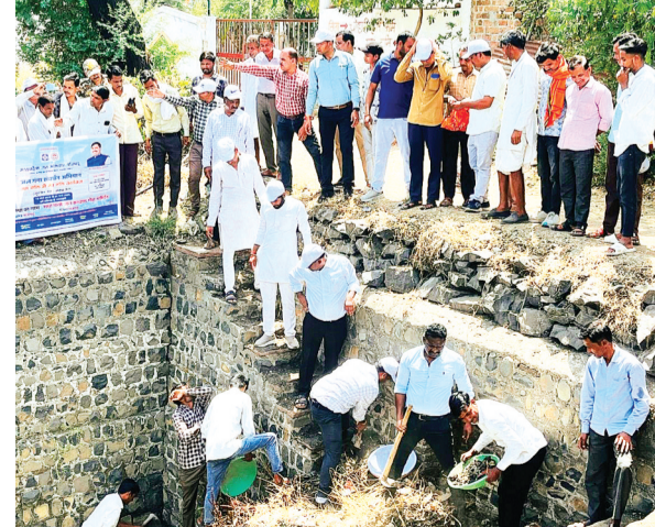
हरिभूमि न्यूज ▶▶ राजगढ़

08 बावड़ियों में ग्राम स्तर पर जनसहभागिता के साथ पुताई, श्रमदान व सफाई कार्य जारी है। इसी तरह नरसिंहगढ़ जनपद में चिन्हित 15 बावड़ियों में से 12 में कार्य प्रगति